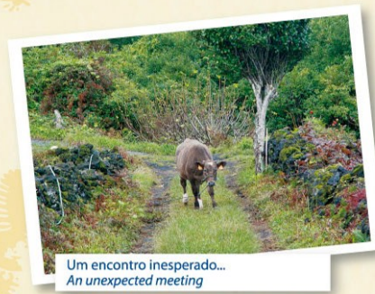
Um encontro inesperado... An unexpected meeting